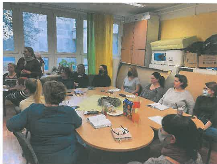
1. ábra: Munkaközösségünk megbeszélés közben

Munkaközösségünknek nem tagjai, de a minden napi munkánk résztvevői az utazó pedagógusok, a logopédus, a szurdopedagógus, a szomatopedagógus, a mozgásfejlesztő pedagógus is. Velük összedolgozunk, megbeszéljük a gyermekek egyéni fejlődésének legmegfelelőbb módszereket, lehetőségeket.