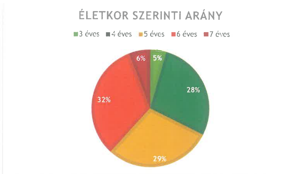
3. ábra: Gyermek életkor szerinti aránya

A 6. életévüket töltők igen nagy létszámban vannak jelen, több gyermeket közülük fölmentett az OH a tankötelezettség megkezdése alól, ami előre jelzi nekünk, hogy a következő tanévben nem fogunk tudni felvenni minden gyermeket, akinek a Szakértői Bizottság a mi intézményünk óvodáját jelöli ki.